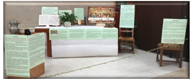
Les fondements du protestantisme

Du 1 er juillet 2023 au 22 octobre, 20 personnes ont assuré 59 permanences. Nous avons eu plus de 2300 visiteurs, enchantés, qui l'ont signalé dans le livre d'or : un vrai succès ! Nous avons également vendu beaucoup de pots de confiture. D'autres permanences seront organisées selon les événements dans le village. L'équipe de pilotage du bicentenaire tient à remercier toutes les bonnes volontés qui ont contribué à la réussite du lancement du bicentenaire du temple de Désaignes, et qui continuent à assurer les permanences de l'exposition.