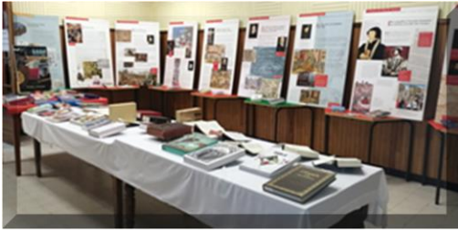
La Bible un livre à découvrir et l'Édit de Nantes

Les cinq expositions du temple sont permanentes jusqu'au 30 juin 2024 : les protestants dans la cité, l'Église missionnaire, et celles qui sont représentées par les images ci-dessous :