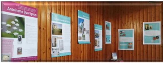
Femmes d'espérance et d'exception